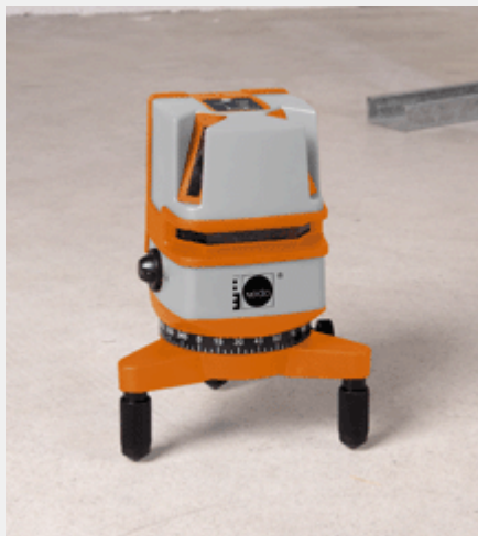
X-Liner 3 № 460 873